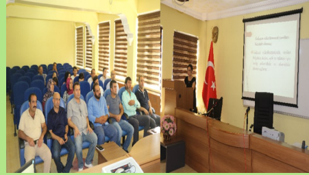
Süt Ürünleri Üreten İşletmelere Yönelik Eğitim Düzenlendi. Sayfa 7'de