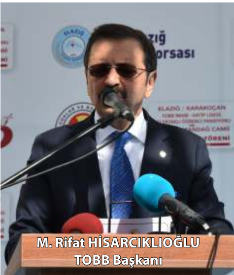
M. Rifat HİSARCIKLIOĞLU TOBB Başkanı

Bu okul ve bu cami hiç şüphesiz, ölçülemeyecek fedakârlıkların, yorgunlukların, umudun ve çabanın sonucunda bu hale gelmiştir. Emeği geçenleri tekrar tebrik ediyorum. Sizler fedakârlık gösterip, gayret sarf ederek böyle güzel eserleri vücuda getirdiniz ve Kur'an-ı ifade ile gerçek müminler olduğunuzu ispat ettiniz. Yüce Allah hayırlarınızı kabul etsin." dedi.