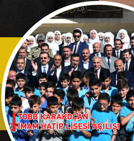
TOBB KARAKOÇAN İMAM HATİP LİSESİ AÇILIŞI