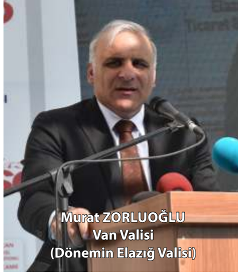
Murat ZORLUOĞLU Van Valisi (Dönemin Elazığ Valisi)

Yine hem bu okulumuzun öğrencilerine bir tatbikat camisi olarak hizmet verecek olan, hem de bu bölgede yaşayan vatandaşlarımızın günlük ibadetlerini yapabilecekleri bu muhteşem mabedin burada yükselmesine vesile olan Ticaret Borsası Başkanımıza ve ekibine huzurlarınızda teşekkür ediyorum. Bilindiği gibi ülkemizin en güçlü yanlarından birisi oldukça genç ve dinamik nüfusumuzdur.