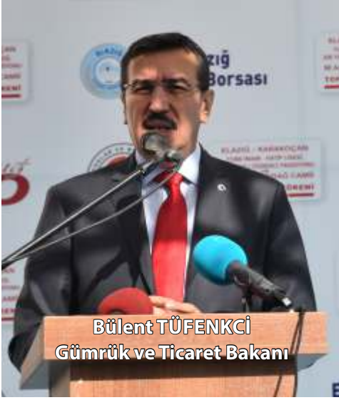
Bülent TUFENKCI Gümrük ve Ticaret Bakanı